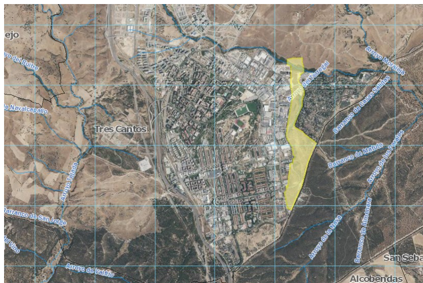
Figura 1. Ámbito de actuación del sector del Plan Especial

Se ha efectuado la consulta en el visor del Sistema Nacional de Cartografía de Zonas Inundables (SNCZI), http://sig.mapama.es/snczi/ , obteniéndose la inexistencia de estudios oficiales relativos al dominio público hidráulico de cauces, zona de flujo preferente o zonas de peligrosidad por inundación en las inmediaciones del ámbito de actuación.