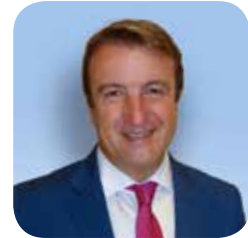
Jesús Moreno Alcalde de Tres Cantos